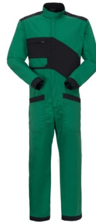
VY – VERDE/NERO