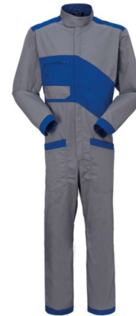
30 – GRIGIO/AZZURRO