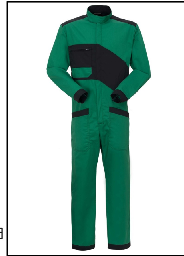
VY – VERDE/NERO